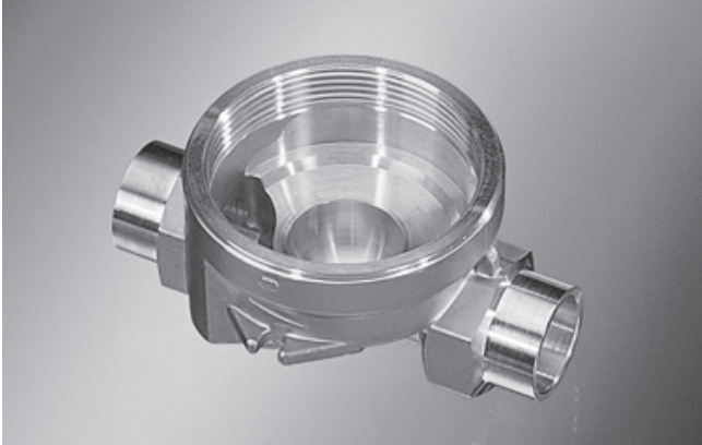
Art.-Nr.: 160310 (L15), 160410 (L18), 160510 (L22), 160128 (L28)